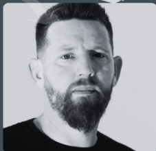
Gêrôme Bouda Plate-forme Allindi (France)